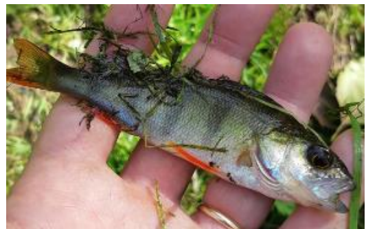
Black-bass ou perche pour les membres du XXS