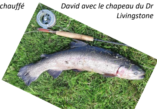
Belle arc-en-ciel et fario dodue (à droite)