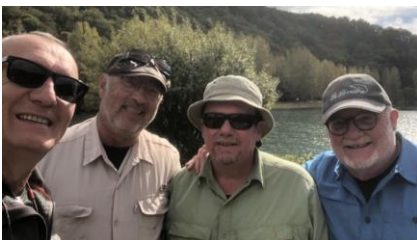
After à Verrières