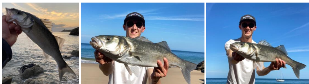
Timothé à la mer