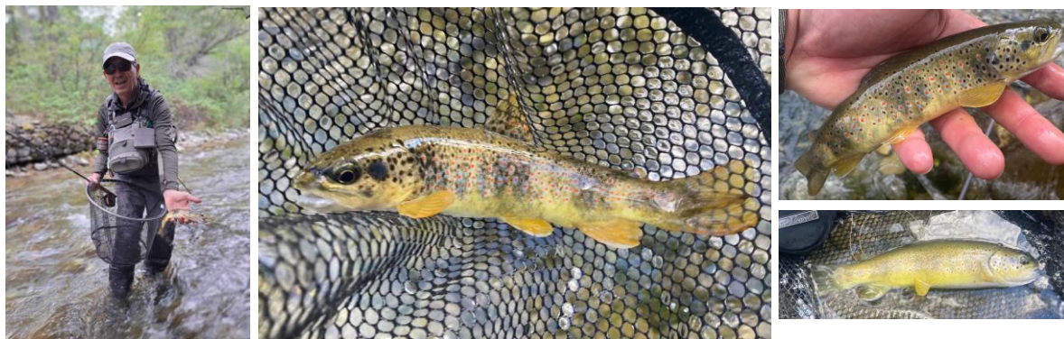
Yves sur la Clarée