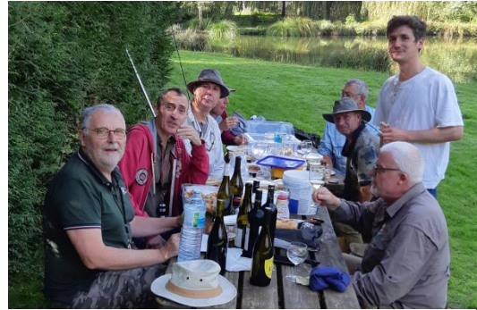
La Cène. Vous pouvez noter que la table était en pente, ce qui a provoqué une accumulation de bouteilles en bout de table.