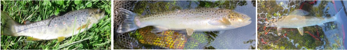
Lendemain sur la Touques. Du granit au calcaire. Poissons brillants et plus gras.