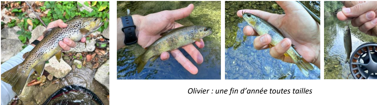
Olivier : une fin d'année toutes tailles