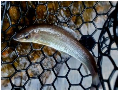
Aurélien sur la Vienne