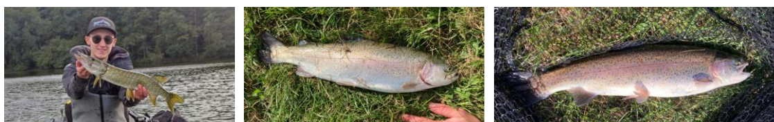
Timothé à la campagne