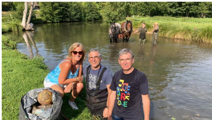
Nettoyage de la Lévière